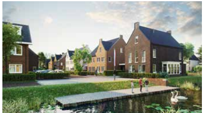
Type Kees, fase 2

Op dit moment is De Nieuwe Buurt in aanbouw. De woningen in fase 1 zijn inmiddels allemaal verkocht, inmiddels is voor een aantal woningen het hoogste punt bereikt. In fase 2 is nu ook in verkoop en kent een gevarieerd aanbod met onder andere ruime vrijstaande woningen, twee-onder-één-kapwoningen en hoek- en tussenwoningen. ●