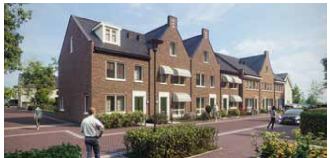
Type Wim, fase 2