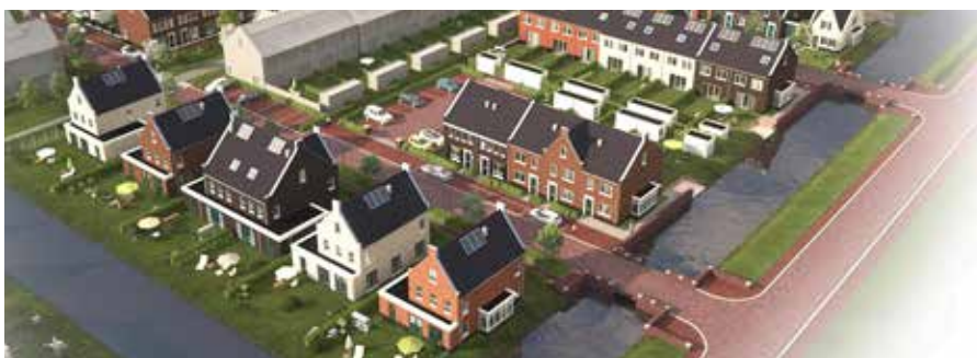
Impressie van de bruggen